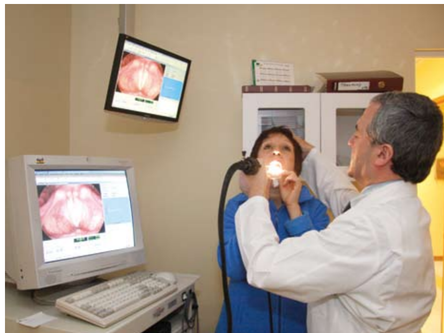
Toda persona que presente problemas para hablar, especialmente un profesor, lo primero que tiene que hacer es consultar al otorrino.

“Si un profesor siente que su voz está agotada, es recomendable que prepare un buen baño de vapor para la cara, al agua hirviendo debe agregar tres cucharadas soperas de sal y 40 gotitas de propóleo, con el fin de lubricar y dar humedad a sus agotadas cuerdas. Pero lo fundamental es acudir precozmente al otorrino”.